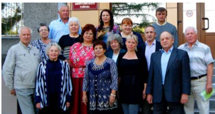
«Зеленоламповцы» 2016-го года.

Вопрос о названии решился довольно просто: встреча творческих людей проходила за столом с настольной лампой с зеленым абажуром.